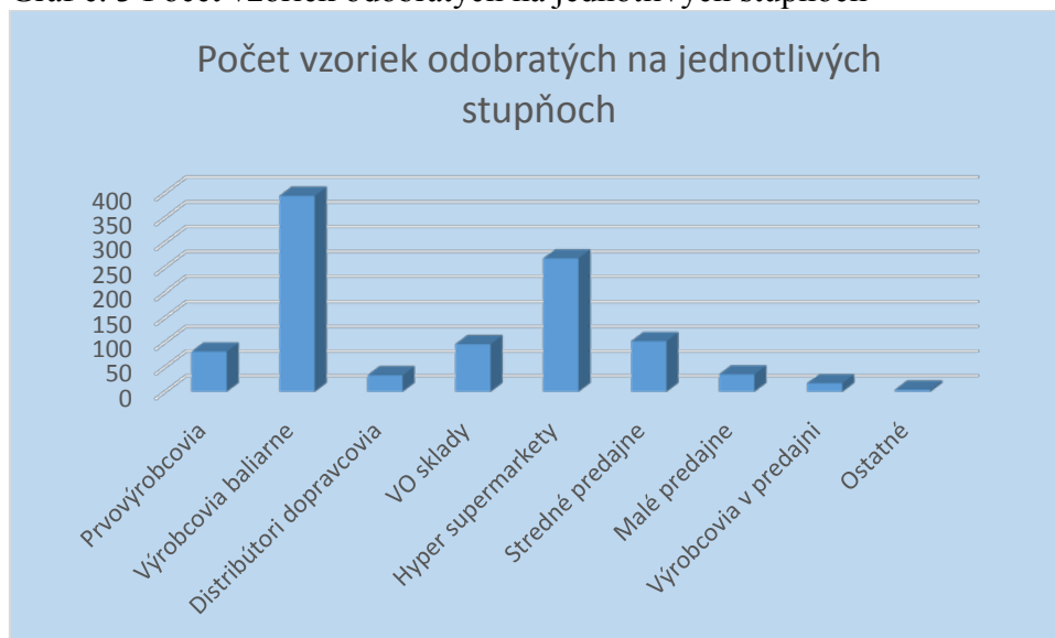
Graf č. 3 Počet vzoriek odobratých na jednotlivých stupňoch